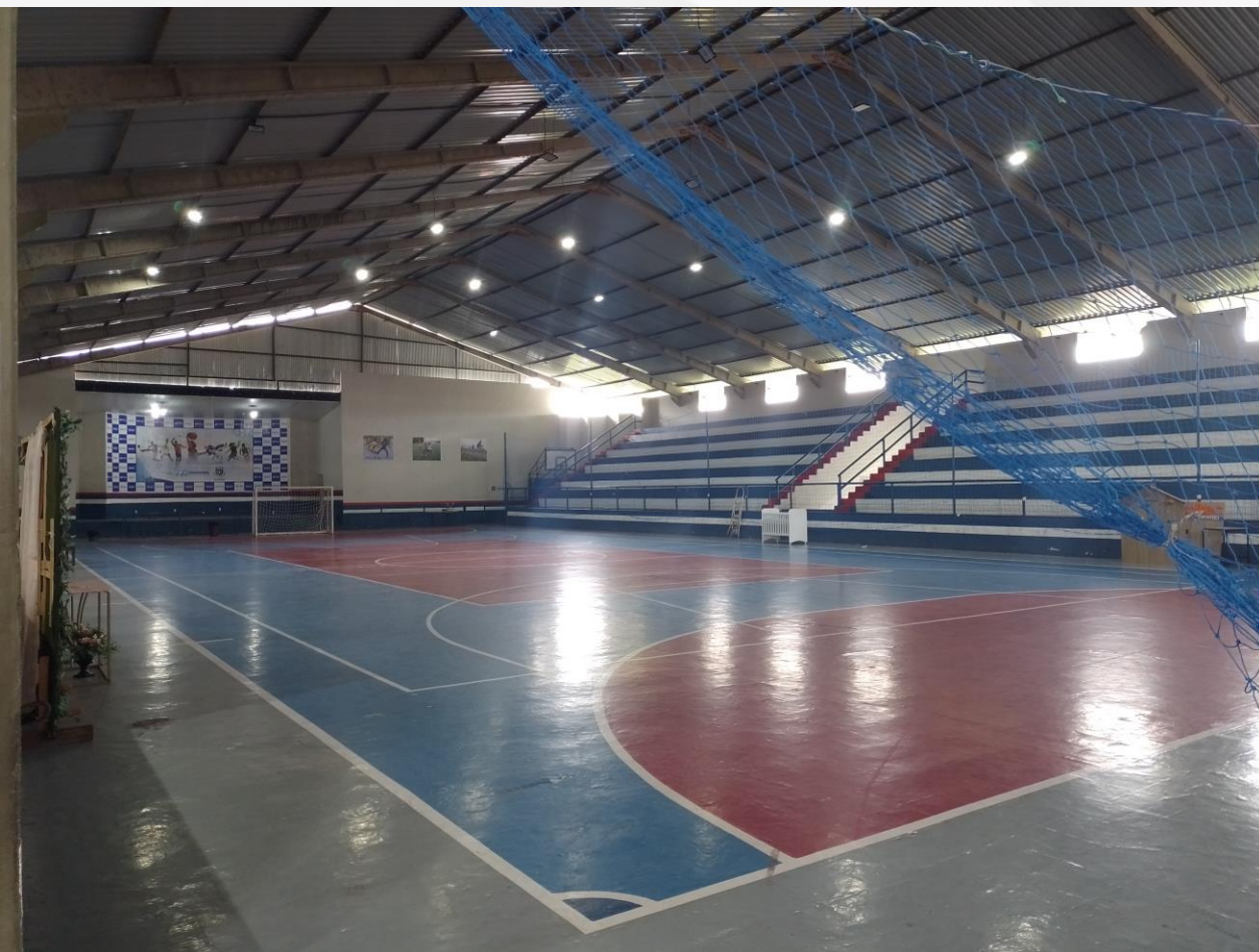
INTERNO - QUADRA