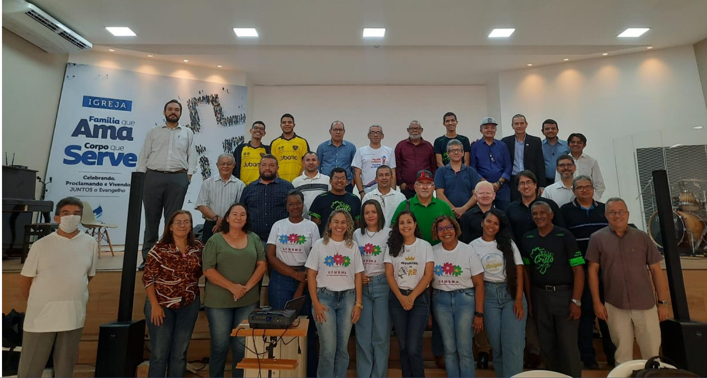
Convenção Batista Maranhense