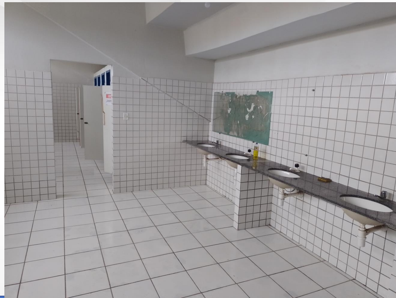
INTERNO - VESTUÁRIOS