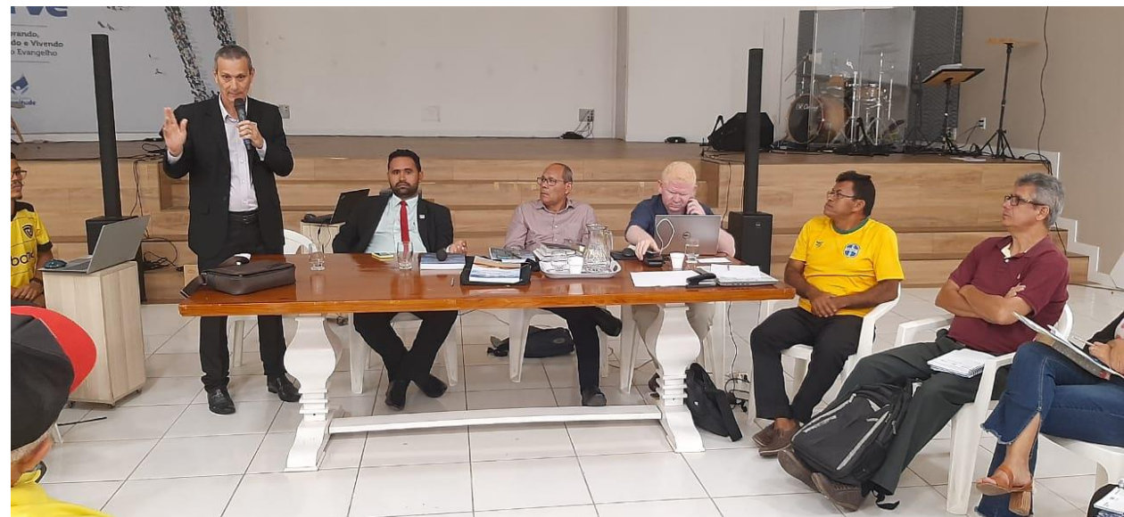
Convenção Batista Maranhense