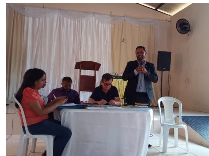
Convenção Batista Maranhense