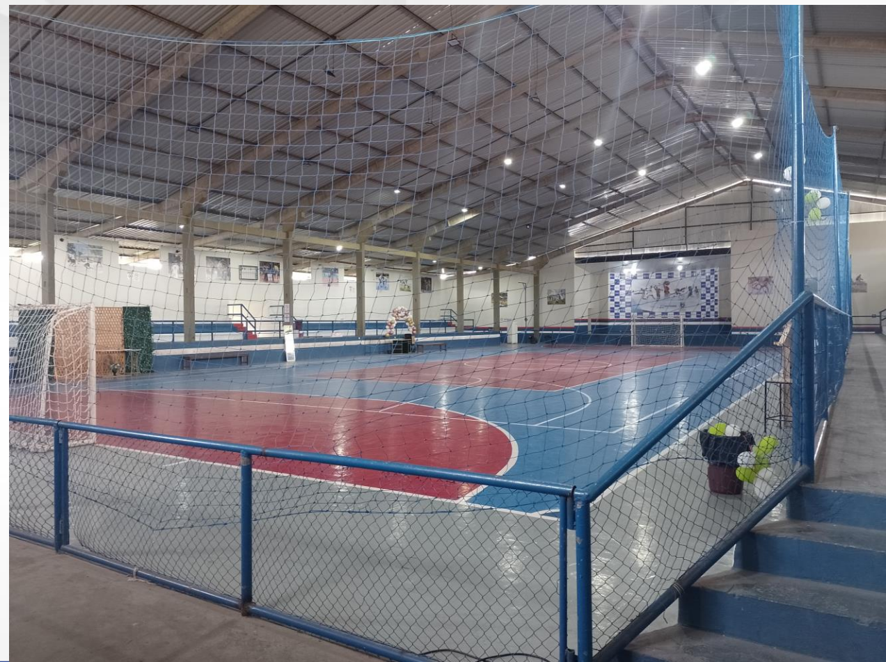
INTERNO - QUADRA