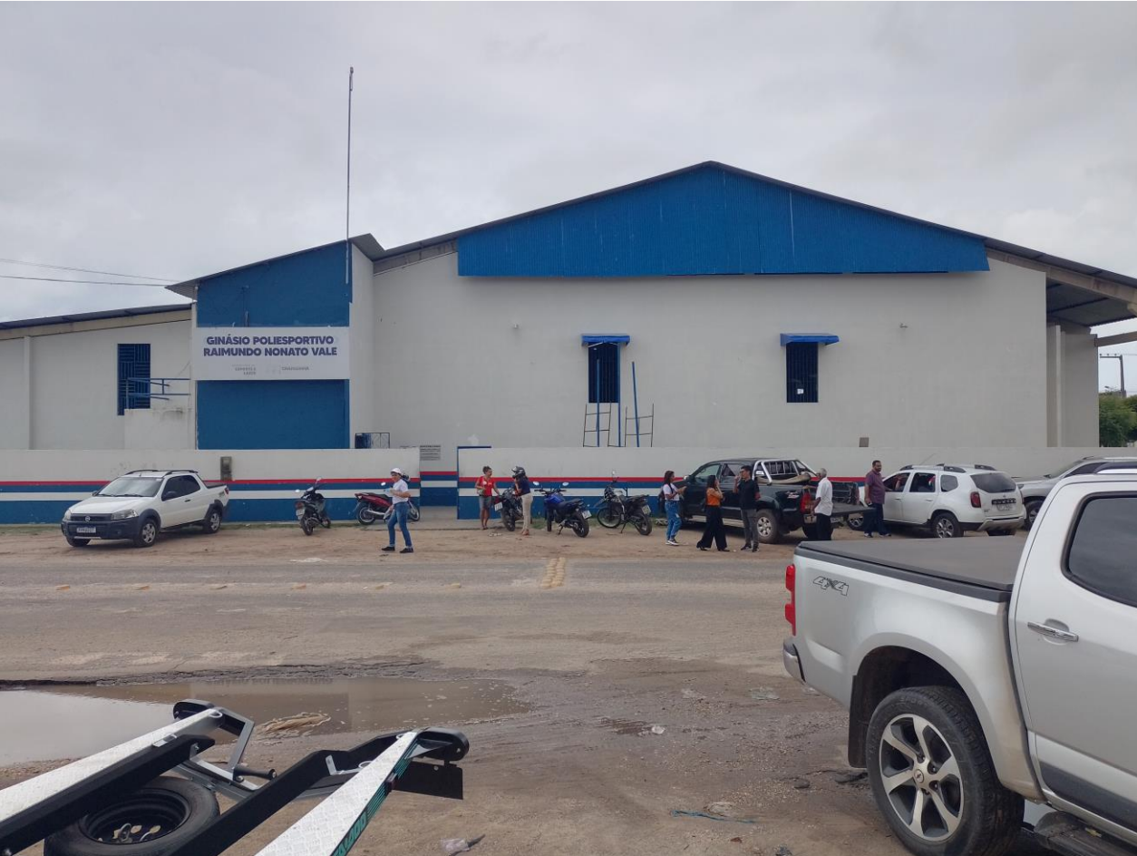
FACHADA - FRENTE