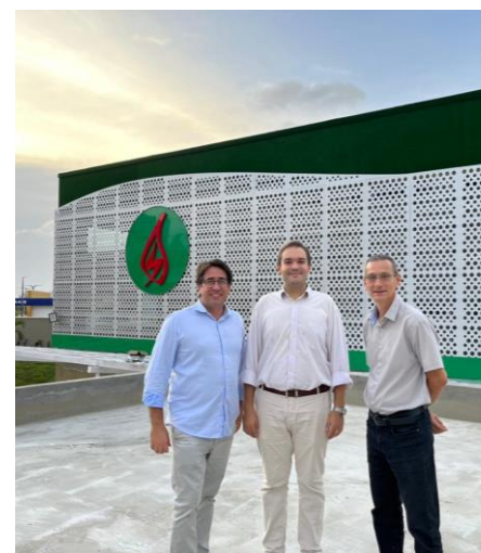
Visita ao Colégio Batista (nova unidade Calhau)