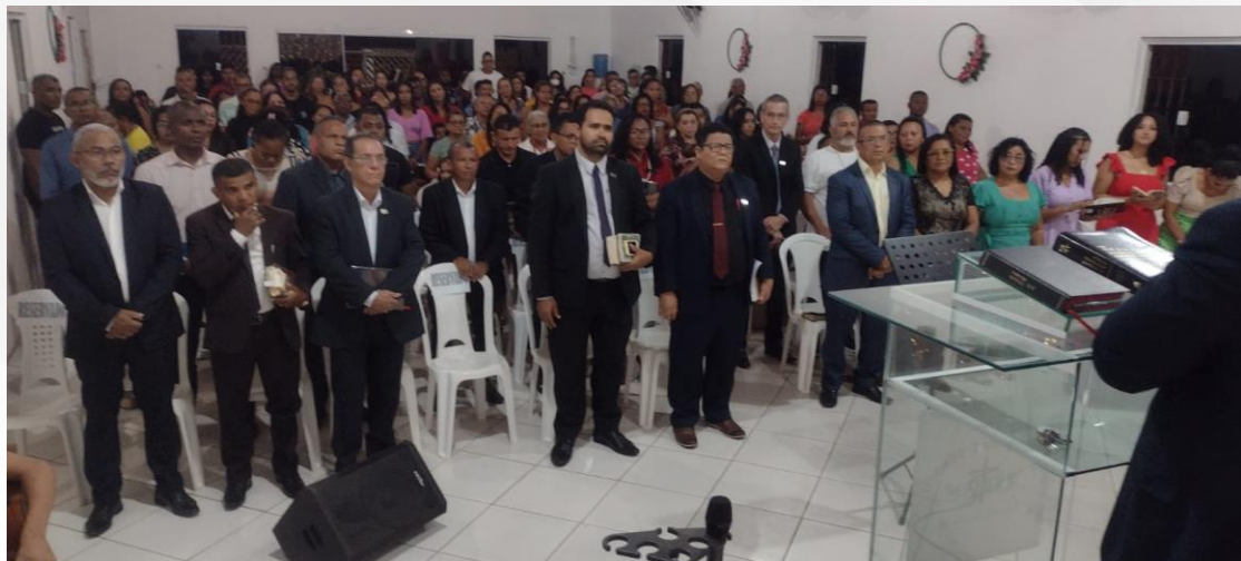
Aniversário da IB El Shaddai