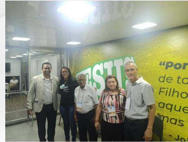
Encontro com o Coord. da Carreta Missionária