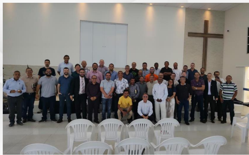
Conferência e Café da IB Vale do Jordão