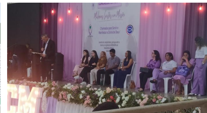
Representação no Congresso da MCM, na cidade de Carutapera