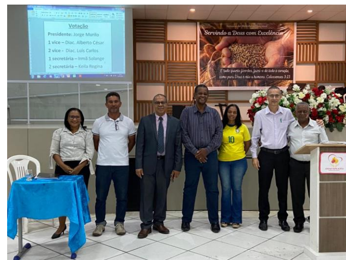
Encontro de Diáconos Batistas , no tempo da IB Monte Sinai - Maiobão