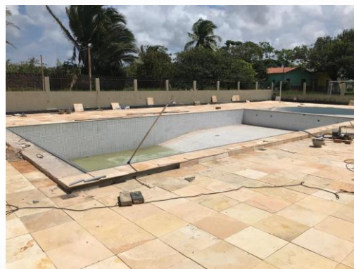
Fotos da reforma a Piscina do ABA

Resultados: Locações realizadas: R$ 4.500,00; Despesas: 11.126,90