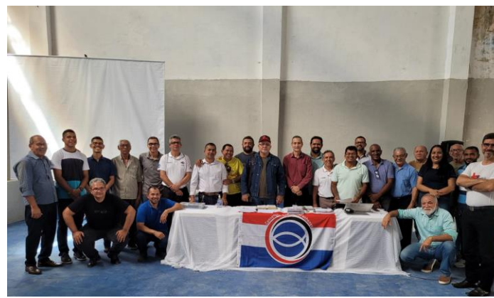
Reuniões dos Conselhos Gerais da CBM e CBB