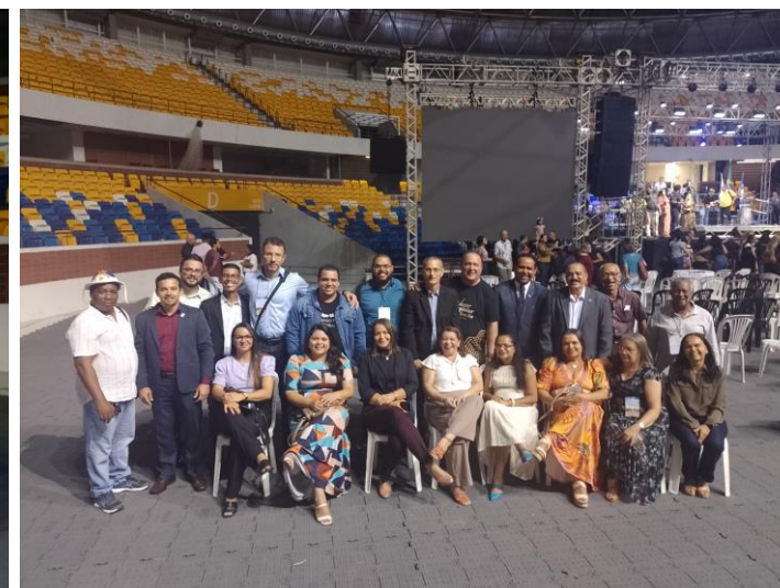
Caravana CBM 2023 - 102ª Assembleia da CBM, em Recife - PE