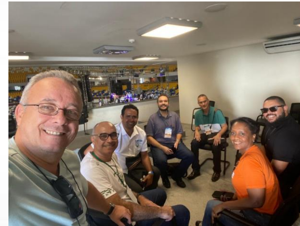
Reunião com Coordenadores do Projeto Cristalândia - JMN